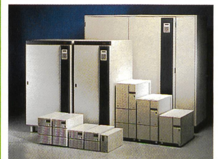
Umwelt- und kundenfreundliche USV-Anlagen 0,7-4500 KVA

Niedrigste Infrastruktur- und Betriebskosten gegenüber anderen USV-Technologien