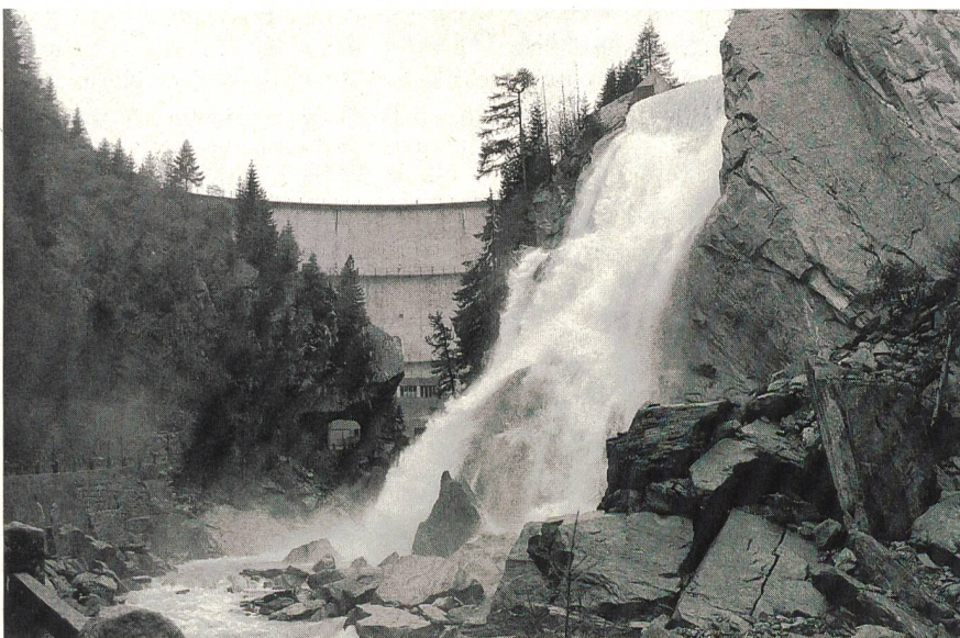
Le point: les débits résiduels à préserver lors de prélèvements d'eau destinés au turbinage.

à préserver lors de prélèvements d'eau destinés en particulier au turbinage. Finalement, le texte de loi a été remanié sur la base d'un compromis obtenu laborieusement, surtout sous la pression de l'initiative dite «pour la sauvegarde de nos eaux».