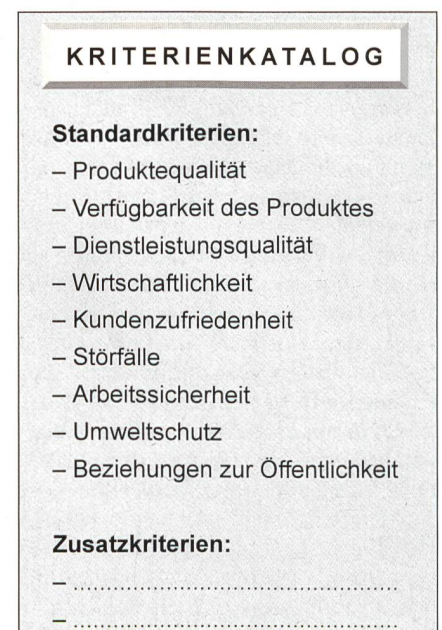
Bild 3 Kriterienkatalog

Nachdem sich ISO-9000 ff als weltweiter Standard für QM-Systeme etabliert hat, stellt sich die Frage nach dem Wozu eines BQM-Standards. Könnte dasselbe Ziel, nämlich die Zukunftssicherung durch Qualität im umfassenden Sinne, nicht auch mit einem konventio-