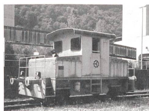
Die Rangierlok Stadler Ta 2/2 soll modernisiert werden.

wird direkt die Fahrgeschwindigkeit bestimmt. Durch die neue Parallel-/Serie-Schaltung der zwei Akkumulatoren mit 180/360 Volt und die Parallel-/Serie-Schaltung der Gleichstrommotoren können 14 Fahrstufen realisiert werden. Im unteren Fahrbereich wird mit der feineren Abstufung praktisch ein stufenloses Fahrverhalten erreicht. Allerdings ist in diesem Betrieb der Wirkungsgrad der Lok recht ungünstig, weil ein grosser Teil der Spannung über den Vorwiderständen in Wärme umgewandelt wird.