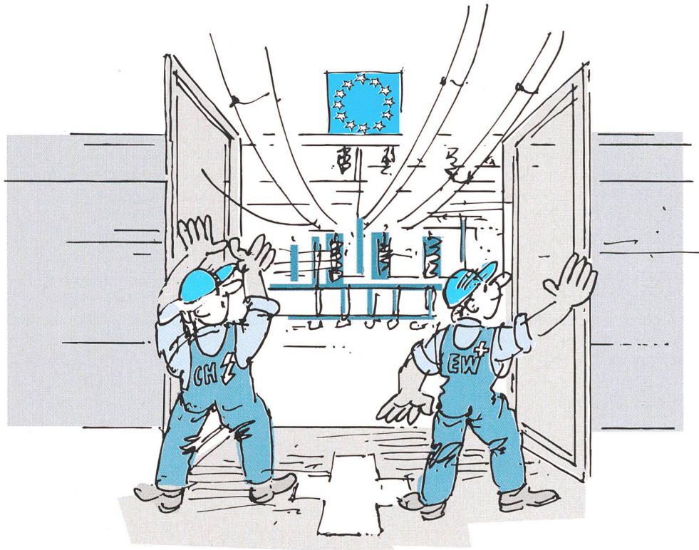
Schrittweise Öffnung des Strommarktes mit neun Jahren Übergangsfrist.

Als berechtigte Kunden gelten bei Inkrafttreten des Gesetzes die Grosskonsumenten mit einem Jahresverbrauch von