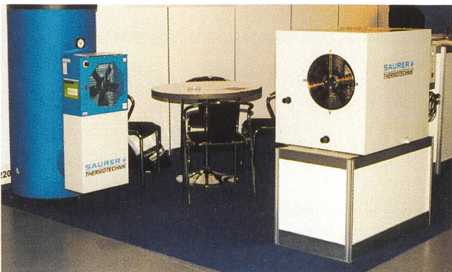
Auch Wärmepumpen werden im Rahmen des Investitionsprogramms «Energie 2000» gefördert.

Cette électricité sera en majorité produite par des centrales thermiques (charbon) malgré les colossaux projets hydrauliques tel celui des Trois-Gorges. Ces projets nécessiteront des investissements de l'ordre de 500 milliards de dollars dont 20% environ devraient venir de l'étranger.