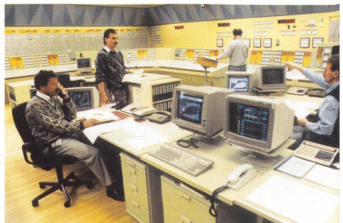
KKW Leibstadt (Kommandoraum): neuer Höchstwert der Nettoproduktion.

23 Mrd. kWh. Die jährlichen Schwankungen beruhen unter anderem auf unterschiedlich langen Stillstandszeiten während der Jahresrevisionen. Zum erneuten Rekordergebnis haben