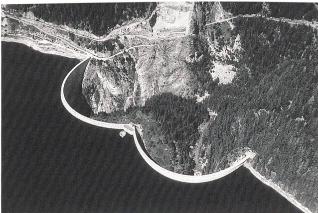
Am zweiten Tag der Tagung findet eine Exkursion mit Besuch der Staumauer Hongrin statt.

Nähere Auskünfte erteilt die SNGT-Arbeitsgruppe Talsperrenbeobachtung, c/o Bundesamt für Wasserwirtschaft, Postfach, 2501 Biel, Telefon 032 328 87 25, Fax 032 328 87 12.