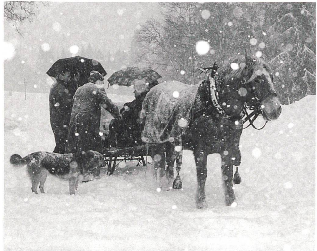
Stimmungsbild der Winterlandschaft anlässlich des Ausfluges der COCOM zum Windkraftwerk Mont-Croisin.