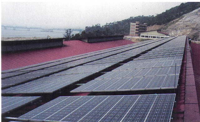
In der chinesischen Provinz Shenzen wurde die grösste Photovoltaikanlage Chinas eröffnet.

zeit auf dem Dach eines neuen Produktionsgebäudes montiert. Die Photovoltaikanlage ist nach erfolgreicher Inbetriebnahme im letzten September durch die Firma Siemens an den Kunden übergeben worden. Sie soll jährlich rund 140 000 kWh erzeugen. Dies entspricht etwa 10% des Strombedarfes dieser Fabrik.