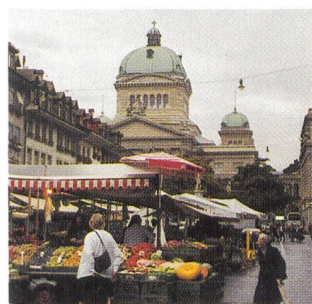
Marktöffnung in Bern.

(v) Die Liberalisierung des Strommarktes hat auch auf die Gemeinden Auswirkungen. Damit diese sich rechtzeitig vorbe-