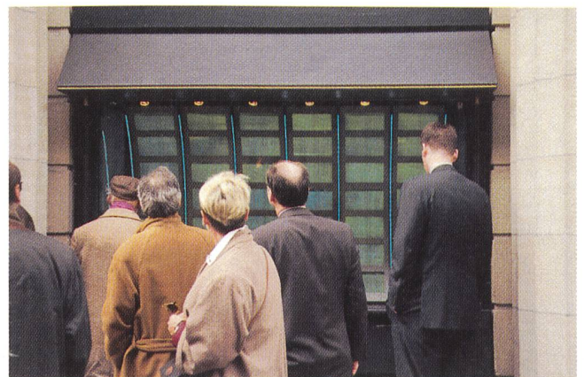
Neben SPI und Dow Jones jetzt der SWEP.

einzelnen Stunden noch geringen Liquidität des Spotmarktes wird der SWEP vorerst für die repräsentative Mittagsstunde von 11 bis 12 Uhr des nächsten Werk-tages berechnet. Da sich die Spotmarktpreise im Tagesverlauf sehr volatil verhalten, werden die Einheitspreise jeder Stunde mit einer geeigneten