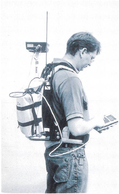
Bild 3 DGNSS im praktischen Einsatz Erfassung von Positionen und Zusatzattributen

Verbindung mit dem GPS-Empfänger verbunden werden müssen, existieren heute auf dem Markt bereits integrierte Geräte, welche einen GPS-Empfänger und RDS-Decoder vereinen.