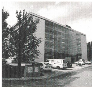
Das neue SVTI-Gebäude in Wallisellen

Die Demonstration unterschiedlicher Produkteprüfungen zeigte, dass vielen Produkten ein beträchtliches Risiko-