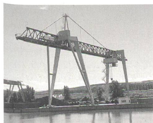
Verladebrücke im Hafen Krems.

(hk) Die Firma Künz in Hard/Vorarlberg am Bodensee, weltweit als Spezialkranhersteller und Lieferant von stahlwasserbaulichen Ausrüstungen tätig, ist derzeit in der Produktsparte Containerkrananlagen erfolgreich aktiv. Nachdem bereits im ersten Halbjahr 1998 drei Containerkrananlagen für das neue Güterverkehrsterminal der DBAG in Kornwestheim bei Stuttgart, eine Anlage für die Spedition Welz in Salzburg und eine Brücke für den