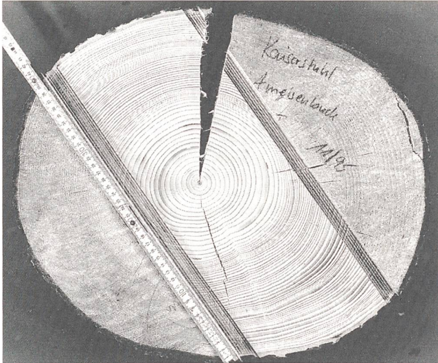
Lässt Bäume sprechen: Präzisionsfräsmaschinen machen die Mikrostruktur eines Baumstamms sichtbar.

im Mikrometerbereich verrät jedoch weit mehr über die Geschichte der sonst stummen Waldbewohner. Denn die Bäume reagieren mit ihrem Wachstum auf die unterschiedlichen Umweltbedingungen, etwa wenn sich das Klima ändert, besondere Witterungsverhältnisse herrschen oder bei Insektenfrass und Konkurrenzveränderungen durch Nachbarbäume. Um die in den Baumstämmen enthaltenen Informationen zu entziffern und für die Abschätzung von vergangenen Umweltveränderungen zu nutzen, sind hochgenaue Präparationsverfahren notwendig, mit denen zudem in kurzer Zeit grosse Flächen bearbeitet und inspiziert werden können. Gemeinsam mit dem Institut für Waldwachstum der Universität Freiburg i. Br. arbeitet das Fraunhofer-Institut für Werkstoffmechanik (IWM) an der Entwicklung eines geeigneten Verfahrens.