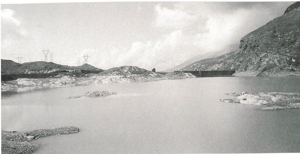
Speicherseen im 1. Halbjahr gut genutzt (Lago Bianco am Berninapass).