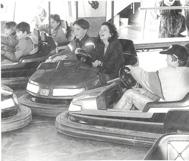
Viel Strom an der «Chilbi».