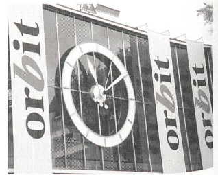
Die diesjährige Informatikmesse Orbit war die grösste in ihrer Geschichte.

Schwerpunktthemen der Orbit 98 waren die Zukunftstechnologien der IT-Branche, vor allem die Digitaltechniken, neue Telekommunikationstrends sowie Internet und Intranet. Neu war der Fachbereich «Publishing: Prepress, Druck/Kopie und elektronische Medien», mit dem die grafische Branche erstmals einen jähr-