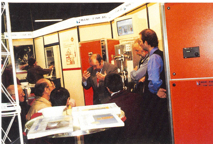
Bild 5 Wichtige Informationen konnten an den einzelnen Ständen direkt und kompetent bezogen werden.