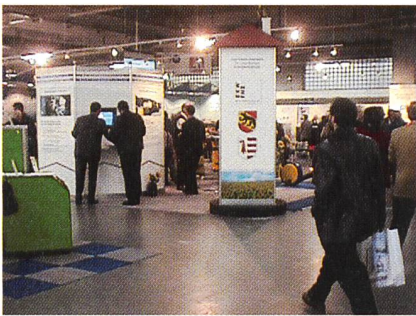
Bild 1 Die Wärmepumpen-Ausstellung in der BEA bern expo bot vielen Besuchern eine kompakte und doch umfassende Informationspalette.