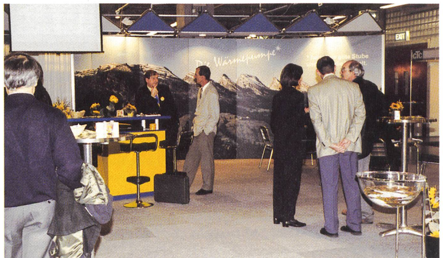
Bild 2 Gemeinschaftsstand der Elektrizitätswirtschaft und des Wärmepumpen-Testzentrums.

Im Workshop 1 unter dem Titel «Gute Geschäfte mit Wärmepumpen – warum, womit und wie?» wurde vor allem für Anlagenbauer und Installateure aufgezeigt, dass richtig konzipierte Wärmepumpen durchaus ein interessanter Geschäftsbereich sein können. Einleitend