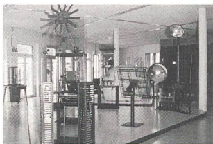
Hier können Besucherinnen und Besucher selber aktiv Forschung erleben und Wissenschaft begreifen.

Wie gewinnen Forschende Einblick in die winzigen Bausteine der Materie? Wie versuchen sie, die Tumorthherapie zu verbessern? Wozu sind Grossforschungsanlagen gut? Welche Wege führen zu einer nachhaltigen Energienutzung? Wo liegen Lösungen für die Probleme der Zukunft? Wer Antworten auf solche Fragen sucht, findet manche im psi forum. Das PSI beschreitet damit neue Wege der Kommunikation von Wissenschaft und Technik und will so der Öffentlichkeit die Welt der Forschung näherbringen.