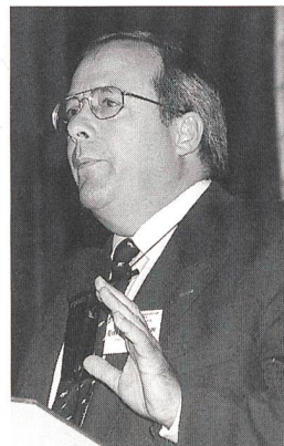
4 Eduard Schumacher: Rezepte für Contracting.