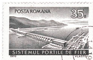
Rumänische Postmarke anlässlich der Einweihung des «Eisernen Tors».

(su) Sulzer Hydro und die ABB Schweiz haben einen Grossauftrag von rund 50 Mio. Franken zur Revision und Modernisierung des rumänischen Wasserkraftwerks «Eisernes Tor» erhalten. Dieser Auftrag ist der erste Teil eines umfassenden Sanierungsprojekts mit Kosten von rund 200 Mio. Franken.