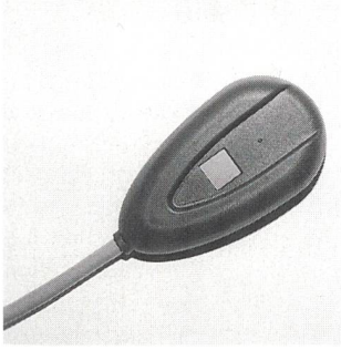
Computermaus mit Fingerprint-Erkennung.