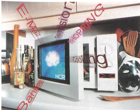
Mikrowellenherd mit eingebautem Fernseher und Internet-Anschluss

steuerung) ist als weitere IO-Einheit vorgesehen. Als hauptsächlichste Einsatzgebiete sieht NCR nebst dem Fernsehen das Internet-Shopping und das Internet-Banking.