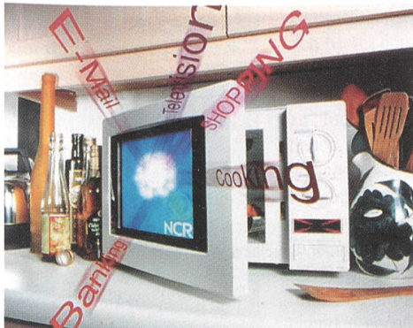
Mikrowellenherd mit eingebautem Fernseher und Internet-Anschluss

steuerung) ist als weitere IO-Einheit vorgesehen. Als hauptsächlichste Einsatzgebiete sieht NCR nebst dem Fernsehen das Internet-Shopping und das Internet-Banking.