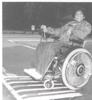
Une idée simple mais utile: rampe pliable pour les handicapés circulant en fauteuil roulant.

Routes et chemins sont truffés d'obstacles pour les handicapés circulant en fauteuil roulant. La Fondation suisse en faveur de l'enfant infirme moteur cérébral rappelle que les