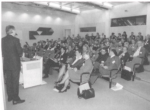
Eine vielfältige Themenauswahl bot sich den rund 120 Teilnehmerinnen und Teilnehmern am Kommunikationsforum vom 29. Januar 1999 in Zürich.