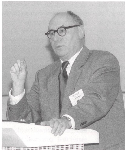
Dr. Grete: «Diese allfälligen panikartigen Reaktionen machen mir potentiell am meisten Sorgen.»