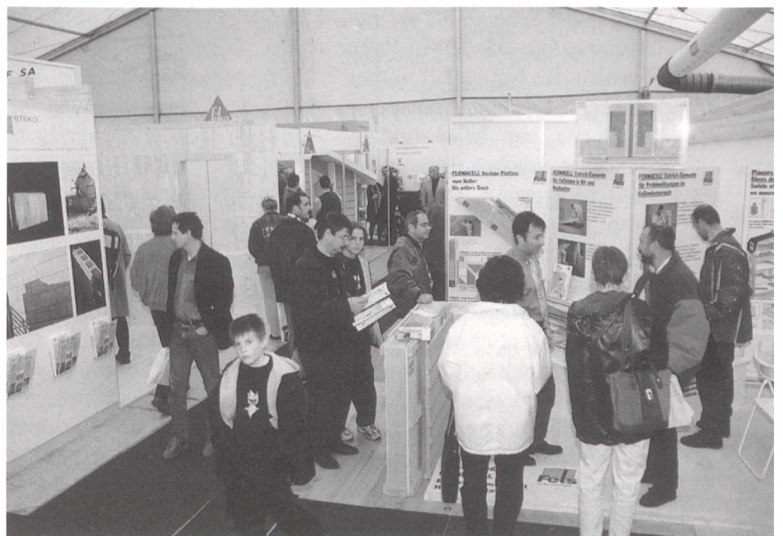
Foto von der 1. Minergie-Messe im 1997. Gegen 200 Aussteller aus den Bereichen Holzhausbau, Haustechnik, Solar- und anderen zeitgemässen Energiesystemen werden an der zweiten Schweizer Hausbau- und Minergie-Messe erwartet.