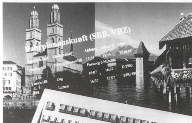
Integrierte Auskunft für Nah- und Fernverkehr

Als weitere Schritte werden die Fahrplaninformation von Haustür zu Haustür und die Unterstützung durch Karten in Aussicht gestellt.