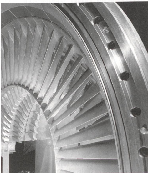
Gasturbinen werden für ABB immer wichtiger.

Im vergangenen Jahr investierte ABB Schweiz 725 Mio. (1997: 710 Mio.) Franken in die Forschung und Entwicklung. Nachdem in den vergangenen zwei Jahren enorme Investitionen in Sachanlagen erfolgt waren, ging dieser Betrag 1998 auf den früheren Jahresdurchschnitt von 146 Mio. Franken zurück (Vorjahr: 188 Mio. Franken). Die Zahl der Mitarbeiter sank als Folge des Verkaufs des Rechenzentrumsbetriebs auf 11 263 (Vorjahr: 11 354). Dank der mit der kalifornischen Raychem Corp. abgeschlossenen Kooperation im Bereich der Überspannungsableiter soll sich die Zahl der Arbeitsplätze am Standort Wettingen in Zukunft