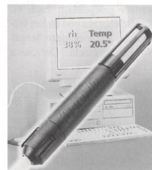
Komfortable Feuchtigkeitsmessung mit Hilfe des PC

Warum schneit es? Warum beschlägt der Badezimmerspiegel nach einer heissen Dusche? Diese und viele andere Fragen beantwortet unser Feuchte-/Temperaturfühler Hygrowin, der direkt an die RS232-Schnittstelle eines PC angeschlossen werden kann. Die