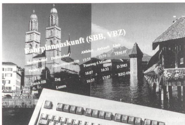
Correspondances d'un bout à l'autre du pays.