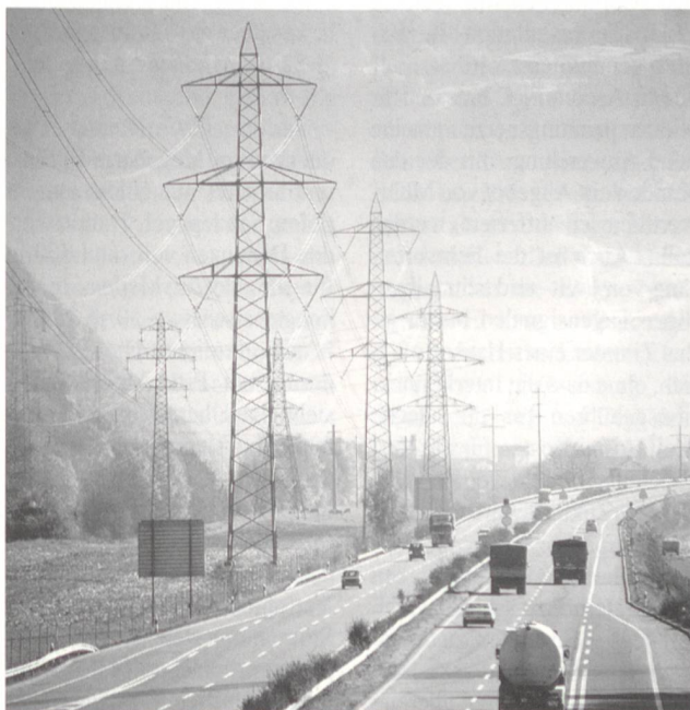
Elektrischer Strom hat keine Farbe.

Auch wenn die Stromleitungen viele Millionen Kilometer lang sind, sie können den durchfliessenden Strom nicht speichern: Die Kraftwerke müssen immer genau die Menge Energie erzeugen, die Motoren, Lampen, Heizung und andere elektrische Geräte gerade benötigen. Steigt die Stromnachfrage an, muss sofort zusätzliche Leistung eingespeist werden. Andernfalls würden Spannung und Frequenz des Netzes sinken und ein Zusammenbruch drohen.