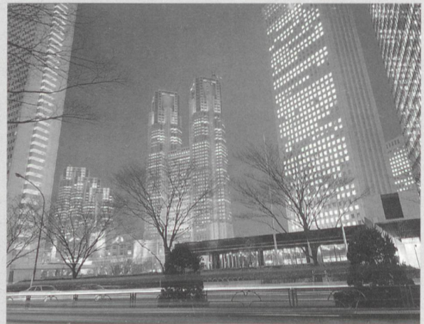
Die japanische Wirtschaft läuft zu 30% mit Kernenergie (Geschäftsviertel in Tokio).

(sva) Die drei japanischen Kernkraftwerksbetreiber Japan Atomic Power Co. (JAPCO), Kansai Electric Power Co. (KEPCO) und Tokyo Electric Power Co. (TEPCO) richten sich darauf ein, ihre ältesten Kernkraftwerksblöcke während 60 Jahren zu betreiben. Sie haben Pläne angekündigt, die Lebensdauer der schon bald 30 Jahre in Betrieb stehenden Einheiten Tsuruga-1, Fukushima Daiichi-1 und Mihama-1 entsprechend zu verlängern, und jetzt beim zuständigen Ministerium (MITI) diesbezügliche Vorstösse unternommen. Nach Ansicht der drei Betreiber stellt die Lebensdauerverlängerung keine grundsätzlichen Probleme. Sie erfordert jedoch gezielte Massnahmen zur Reparatur, Nachrüstung und vertieften Prüfung bestimmter Komponenten. Die entsprechenden Programme sind ausgearbeitet und sollen ab dem 30. Betriebsjahr implementiert werden. Vorgesehen ist unter anderem eine Neubeurteilung der Sicherheit alle zehn Jahre.