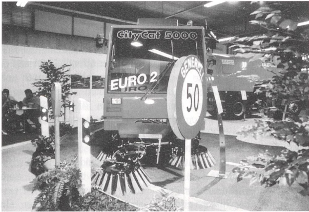
Energistädte: aktive Energiepolitik in 3000 Gemeinden

die in ihrer Energiepolitik Überdurchschnittliches leisten. Bisher betreiben bereits 3000 Gemeinden eine aktive Energiepolitik, 16 davon als «Energistadt»-Label-Trägerinnen. Veranstalterin ist das Bundesaktionsprogramm Energie 2000.