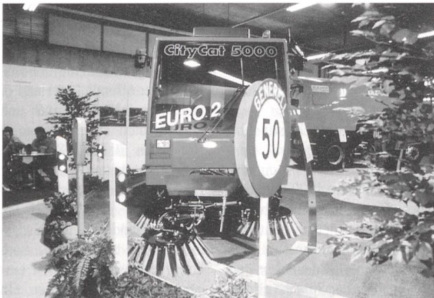
Energistädte: aktive Energiepolitik in 3000 Gemeinden

die in ihrer Energiepolitik Überdurchschnittliches leisten. Bisher betreiben bereits 3000 Gemeinden eine aktive Energiepolitik, 16 davon als «Energistadt»-Label-Trägerinnen. Veranstalterin ist das Bundesaktionsprogramm Energie 2000.