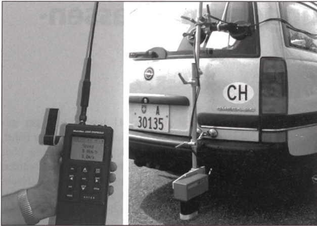
Bild 2 Die Eichung von Nachfahrtachographen, die bis anhin mit einem aufwendigen Messinstrument, einem optischen Korrelator (rechts im Bild), durchgeführt wurde, kann heute mit einem DGPS-Recorder (links) einfacher und kostengünstiger erledigt werden.

dienst für Geschwindigkeitsmessmittel verlangte zuerst nach einer einfacheren, kostengünstigen und doch sicheren Methode für dynamische Messungen.