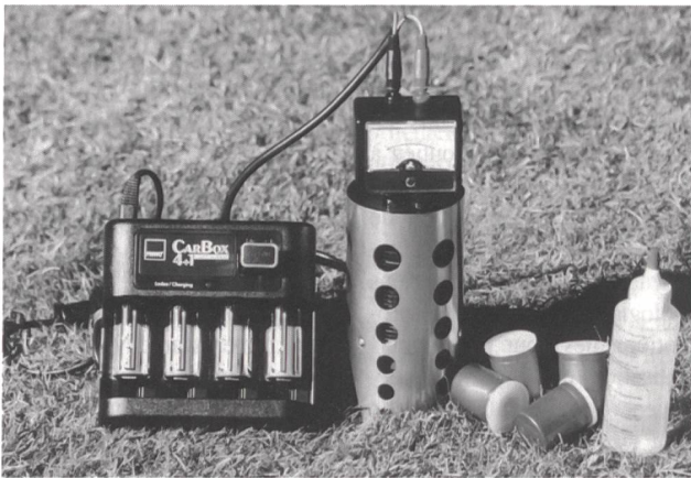
15-W-Brennstoffzelle mit integriertem Wasserstoffherzeuger zur Nachladung von Batterien

Die Tagungsreferate sind in einem Bericht zusammengefasst und können für 200 Fr. erworben werden bei: European Fuel Cell Forum, Postfach 99, 5452 Oberrohrdorf, oder über www.efcf.com .