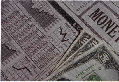
Wird Strom bald eine beliebige Handelsware?

schäfte (finanzieller Markt zur Absicherung gegen Preisrisiken im Spotmarkt), die allerdings nicht direkt bei der Strombörse angesiedelt sein müssen.