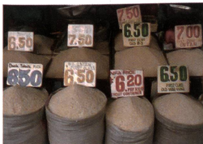
Strom auf dem freien Markt ist ein «kompliziertes» Handelsgut: man kann es nicht lagern und abwarten, bis der Kunde den angeschriebenen Preis bezahlt (im Bild ein Reismarkt).

Im Gegensatz zum Broker kaufen bzw. verkaufen Trader auch dann Volumina, wenn noch kein Gegengeschäft vorhanden ist. Mit der Einnahme derartiger offener Positionen ist, bedingt durch die hohe Volatilität der Preise, ein erhebliches Risiko verbunden. Die Vergütung besteht neben Provisionen aus Preisdifferenzen, die sich in dem Zeitraum zwischen An- und Verkauf der Positionen am Markt ergeben können.