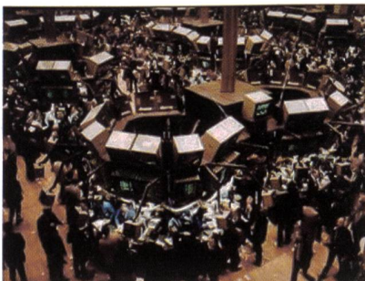
Die Strombörsen-Transaktionen werden weitgehend dezentral und elektronisch abgewickelt und nicht wie hier an der Wall Street.

Grundsätzlich hängt ein funktionierender Stromhandel nicht von einem bestimmten Markt ab. So haben in einigen Fällen Endkunden direkten Zugang zum