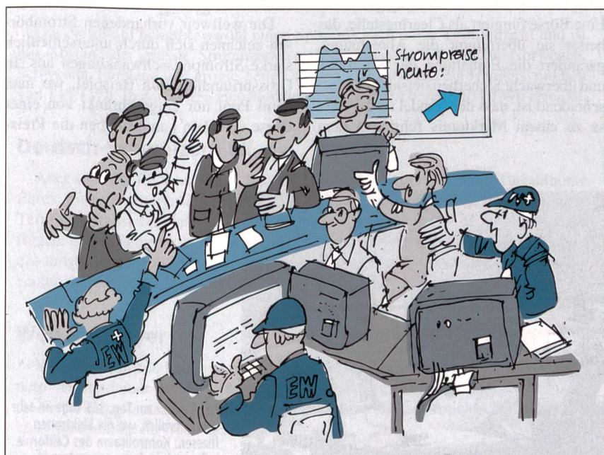
Strombörsen haben im Stromhandel wichtige Aufgaben.

Die weltweite Entwicklung belegt, dass auf liberalisierten Märkten bilateraler und institutioneller Handel (Strombörse) sich ergänzen. Strombörsen haben im Stromhandel wichtige Aufgaben, die den Handel erleichtern und für sichere Grundlagen sorgen. Trotz des Stromhandels an der Börse bleibt der bilaterale Stromhandel – auch als OTC (over the counter)-Handel bezeichnet – dominierend. In liberalisierten Strommärkten mit ausreichend liquider Strombörse, zum Beispiel Skandinavien, ist ein Verhältnis von bilateralem Strom- zu Börsenhandelsvolumen von etwa 80% zu 20% festzustellen.