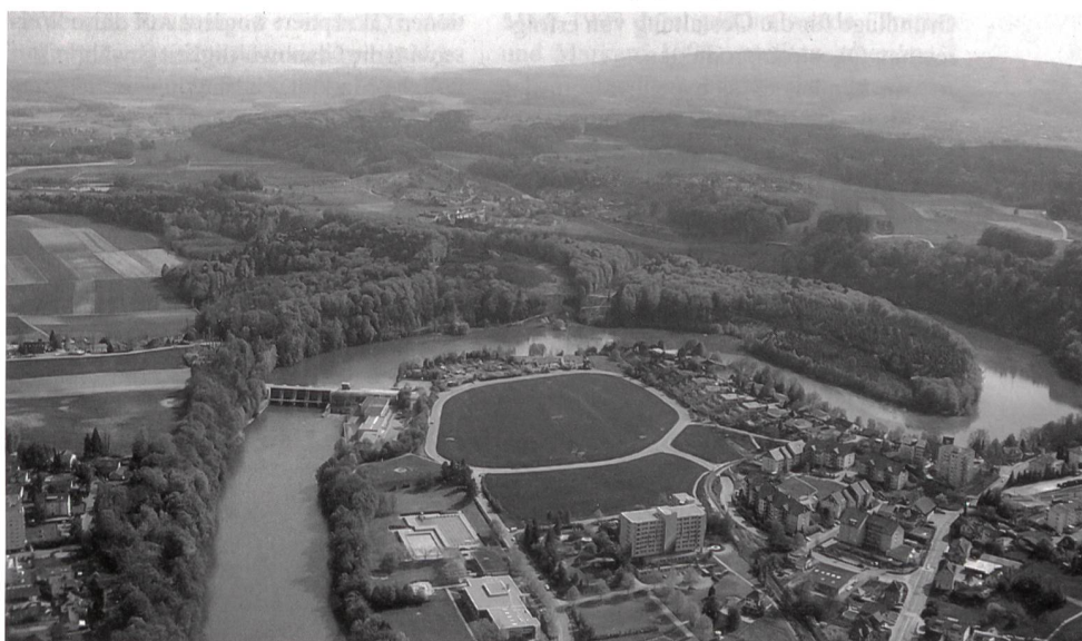
Die Zertifizierung der Wasserkraft stellt für die Schweiz ein zentrales Thema dar.

Die einzelnen Zertifizierungsansätze unterscheiden sich zum Teil recht stark hinsichtlich der verwendeten Kriterien, der berücksichtigten Technologien, des