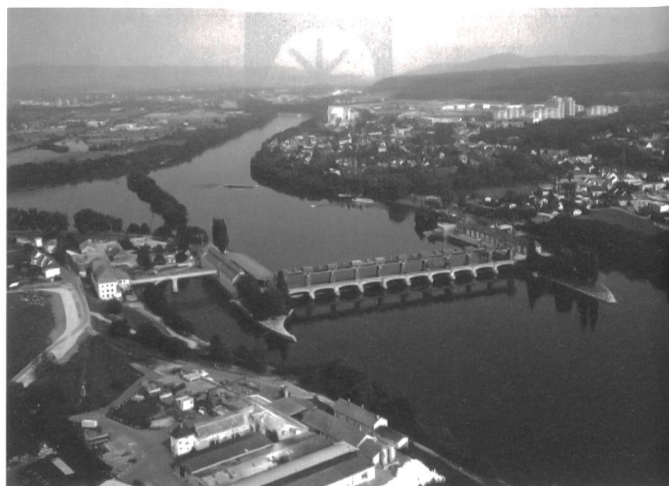
Der Zielerreichungsgrad betrug am 1. Januar 1999 beim Ausbau der Wasserkraftproduktion 85% (von +5% im Jahr 2000; im Bild das Rheinkraftwerk Augst-Wyhlen).