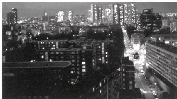
«Service Public»: gleiche Tarife für gleiche Leistungen in ganz Frankreich (im Bild Stromversorgung in Paris).

S'exprimant devant une association d'électriciens, le secrétaire d'Etat à l'énergie américain, Bill Richards, a tiré la sonnette d'alarme. La fragilisation croissante de l'approvisionnement pendant les mois d'été suscite une très vive in-