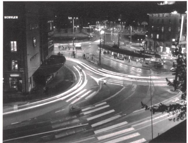
«Die Elektrizitätsversorgung muss eine öffentliche Aufgabe bleiben.»

Einen Wettbewerb kann es nur zwischen Produzenten, Händlern und Brokern und nicht zwischen Transportleitungen geben. Beim Monopolbereich Transportleitungen ist der freie Netzzugang nur über eine Überwachung zu realisieren. Deshalb sprachen sich viele Länder, die bereits in die