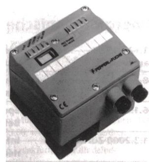
Interbus-Anwendungen ohne Versorgungsleitung

Digitrade AG, 2557 Studen Tel. 032 373 51 64, Fax 032 373 34 70 www.digitrade.ch