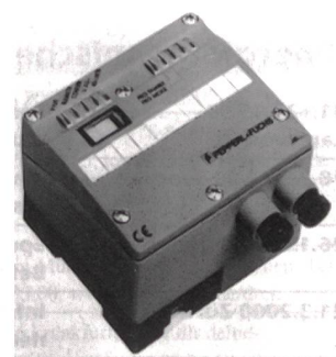
Interbus-Anwendungen ohne Versorgungsleitung

Digitrade AG, 2557 Studen Tel. 032 373 51 64, Fax 032 373 34 70 www.digitrade.ch