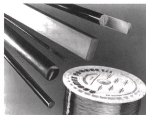
Verbundmetalle für Spezialanwendungen

Speziell entworfene Verbundmetallprodukte, die zwei Materialeigenschaften wie zum Beispiel elektrische Leitfähigkeit und Korrosionswiderstand oder hohe mechanische Festigkeit und Biokompatibilität verbinden, sind von der Firma Anomet Products, Inc., in Shrewsbury, Massachusetts, er-