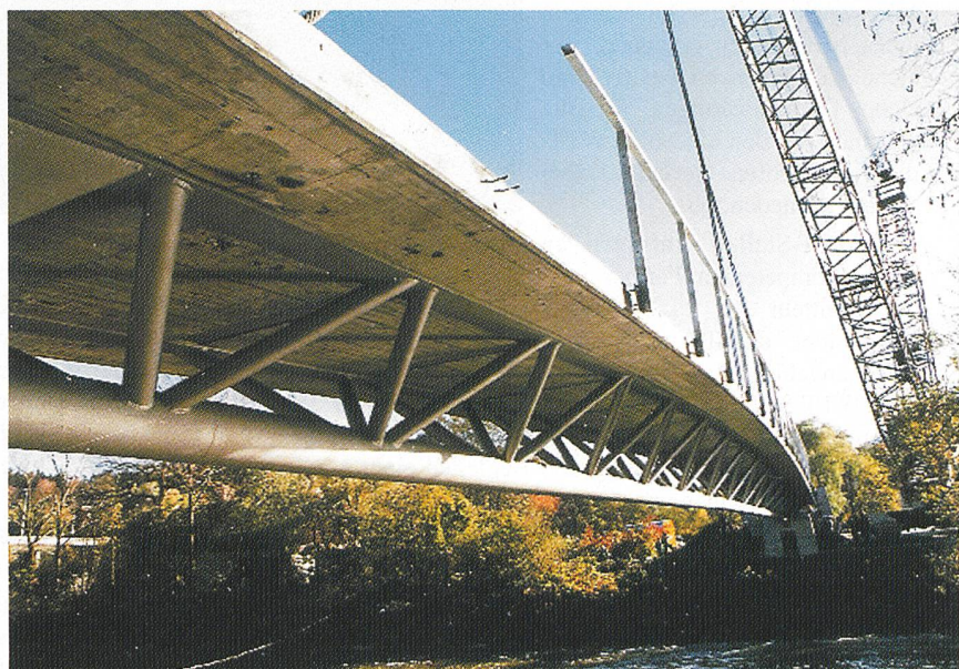
Bild 1 Die Schrägseilbrücke über die Kleine Emme

Mit den Sensoren ist es nun erstmals möglich, die Belastungen innerhalb des Ankerkopfes zu messen. Ausserhalb des Ankerkopfes sind neben Bragg-Gittern auch Dehnungsmessstreifen, Wider-