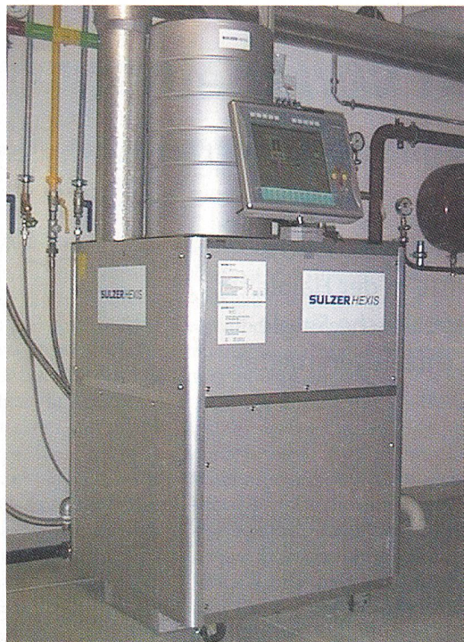
Brennstoffzellen-System (1 kW el) Betreiber: AET Basel (Amt für Energie und Technik), seit 1998