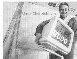
Die Infel hat seit Januar 2000 eine neue Adresse.

(pm) Die Informationsstelle für Elektrizitätsanwendung (Infel) hat neue Räumlichkeiten bezogen. Seit Januar 2000 ist die Organisation in der Militärstrasse 36 in Zürich zu Hause. Die Infel produziert umfangreiche PR- und Kommunikationsdienstleistungen wie auch Verlagsprodukte. Im Zentrum stehen dabei die Kundenzeitschrift Strom in verschiedenen Sprach- und Regionalversionen sowie in zunehmendem Masse individuelle Verlagsdienstleistungen und -produkte für Unternehmen und Organisationen.