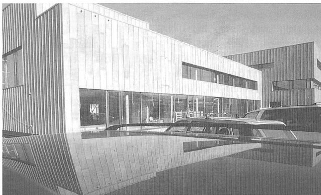
Bei den Erweiterungsbauten des Eidgenössischen Amtes für Messwesen in Wabern wurde eine Filterschicht aus Eisenhydroxid und Kalksand eingebaut, um das von den Fassaden abtropfende Kupfer zu binden.

In einer internationalen Zusammenarbeit zwischen Forschern der Rutgers Universität (New Jersey), dem Landau Institut für Theoretische Physik (Moskau) und dem Institut für Theoretische Physik der ETH Zürich wird gegenwärtig an den Grundlagen für einen Quantencomputer gearbeitet. Forscherteams aus den Gebieten der Quantenoptik und der Festkörperphysik arbeiten bereits an Vorschlägen und deren experimenteller Implementierung, mit dem Ziel, den Grundbaustein eines Quantencomputers, das