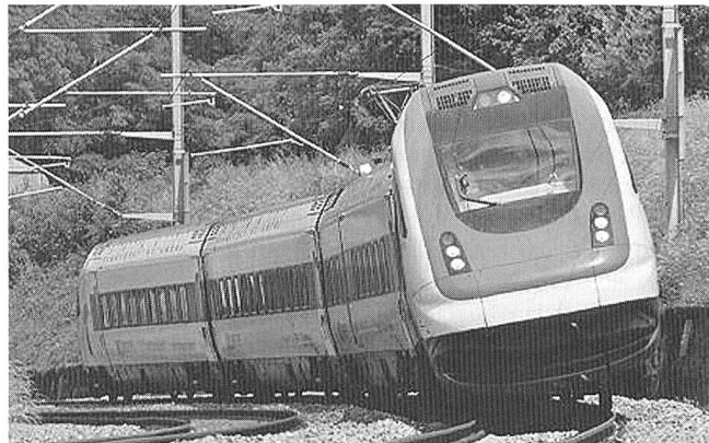
Öffentlicher Verkehr: Technik und Komfort für hohe Passagierzahlen

Bezogen auf die zurückgelegte Distanz pro Einwohner und Jahr liegt die Schweiz mit 1817 km ebenfalls auf dem europäischen Spitzenrang; weltweit führt auch hier Japan mit 1921 km.