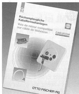
Neue Broschüre über digitale Kabelnetze

Das einwandfreie Funktionieren einer multimedial nutz-