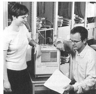
Diagnosesystem Next verfügt über Expertenwissen für weniger Erfahrene

Das System charakterisiert die zu messenden Leitungen nach Merkmalen, wie sie in den Vorschriften festgeschrieben sind: strukturierter / unstrukturierter Dienst, terminierte / nichtterminierte Leitung, Performance-Analyse und Jitter-Toleranz. Mögliche Fehlerursachen sind in einer Datenbank abgelegt. Das System gibt Hinweise zur Fehlerbeseitigung. Neue Erkenntnisse erweitern die Datenbank und führen zu einem immer grösseren Experten-Know-how. Alle wichtigen Standardmessungen wie Bert, Jitter, Offset und G 826 werden automatisch ausgeführt.