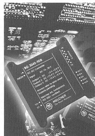
DC-DC-Wandler für bis zu 25 W und drei Ausgangsspannungen

nischen Befestigungslöchern erhältlich, was die Vibrations- und Schockfestigkeit für harte Anwendungen erhöht sowie die Wärmeableitung vereinfacht.