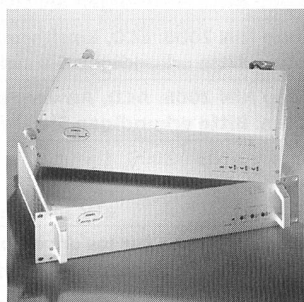
Kompakte Primärschaltregler im 19"-Volleinschub

bereichen von 20 bis 30 V, 40 bis 60 V bzw. 60 bis 90 V sowie programmierbare Versionen. Je nach Typ liefern sie 0 bis 30 V bei 0 bis 125 A, 0 bis 60 V bei 0 bis 63 A bzw. 0 bis 90 V bei 0 bis 42 A. Bei allen Ausführungen sind Strom, Spannung und Leistung einstellbar. Frontseitige Monitorausgänge stellen die Istwerte als normierte Spannungspegel zur Verfügung. Die Geräte entsprechen den neuesten Sicherheitsnormen für die Büro- und Kommunikationstechnik (EN 60950) und den aktuellen EMV-Richtlinien (EN 50081-1 und EN/IEC 61000-6-2).