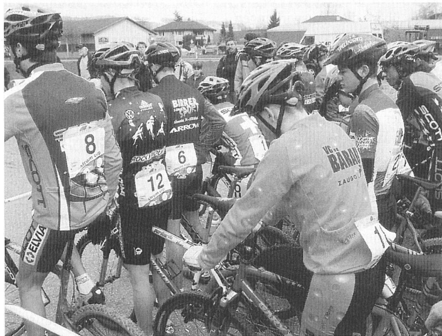
Das Strom-Cup-Rennen ist zugleich Spitzen- und Breitensportanlass.

Am 8. April startete die erste Etappe eines der grössten Events der Strombranche im neuen Millennium: der Strom-Cup. Die alljährlich durchgeführte, von den Elektrizitätsunternehmen gesponserte Rennserie hat den Schweizer Nachwuchs im Mountainbike-Sport entscheidend geprägt. Das moderne Team-Rennen schafft es zudem immer wieder, vor allem auch Anfänger zu begeistern. Für die Elektrizitätswirtschaft ist der Strom-Cup dieses Jahr aktueller denn je, denn auch sie muss sich auf einen Wettbewerb vorbereiten und versuchen, als kleines Team einen internationalen Rang zu erkämpfen.