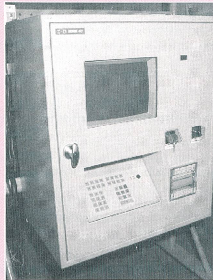
Der Bau von Schaltschränken gehört zum Kerngeschäft der Zemek AG.

Zum Engineeringbereich gehört die Evaluation von Geräten, das Erarbeiten von Lösungsvorschlägen zur Realisierung von unterschiedlichsten Aufgaben zur Messwerterfassung oder Steuerung von Anlagen