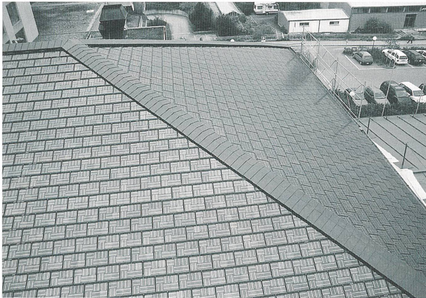
Bild 2 Dreieckförmige Ostseite des Solarschieferdachs des Spitals Burgdorf mit allseitig perfekten Randabschlüssen.