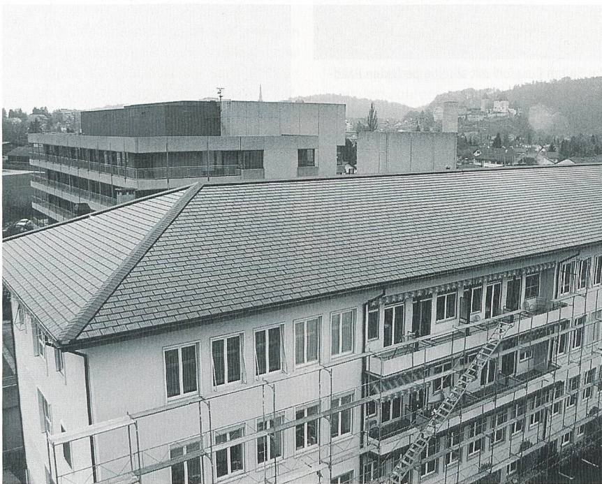
Bild 1 Neu eingedecktes Solarschieferdach des Regionalspitals Burgdorf.

Burgdorf, die Schweizer Stadt mit dem höchsten Solarstromanteil, hat einen neuen Superlativ: Bei der Dacherneuerung des Regionalspitals Burgdorf wurden erstmals stromerzeugende Solarschiefer eingesetzt, die unterschiedlichste Dachformen ganzflächig, inklusive sämtlicher Randabschlüsse, bedecken. Mit dieser technischen Neuerung wird ein grosses Potenzial an Dächern und Fassaden erschlossen, die nun ästhetisch perfekt mit Solarschiefer eingedeckt werden können.