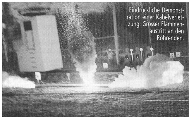
Eindrückliche Demonstration einer Kabelverletzung. Grosser Flammenaustritt an den Rohrenden.

Obwohl sämtliche Teilnehmer die Gefahren bei von unter Spannung stehenden Anlagen und die Auswirkung von Kurzschlüssen an Hoch- und Niederspannungsinstallationen kannten, waren sie von den explosionsartigen Ausdehnungen