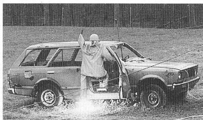
Tödliche Folgen: Auf das Auto ist ein Leiter einer Freileitung gefallen.

der Kurzschlüsse beeindruckt. Der Respekt gegenüber der elektrischen Energie konnte durch diese Versuche bei allen