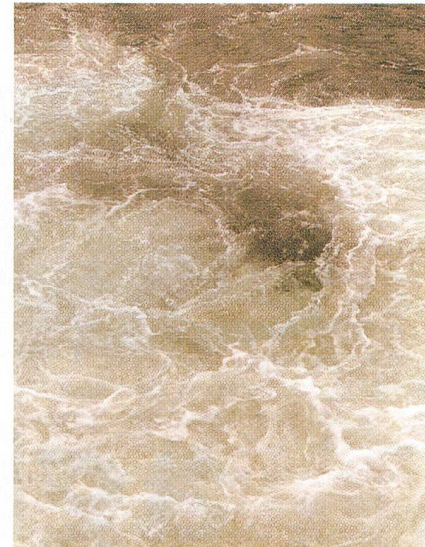
«Wir machen explizit keine Differenzierung zwischen grossen und kleinen Anlagen.»

Als man in der Schweiz in die Liberalisierungsdiskussion eingestiegen ist, hat man gesagt, dass sich Schweizer Strom gegenüber ausländischem Billigstrom absetzen müsste. Das Label ist für die erneuerbaren Energien das ideale Instrument, um diesen Schweizer Strom abzugrenzen. Er bildet eine Marketingklammer für all die Kraftwerke, die erneuerbare Energien produzieren. Wir stehen über den Einzelinteressen und können erneuerbare Energien als solche bei der Vermarktung unterstützen. Gleichzeitig ist es wichtig, dass wir beim Label auch die führenden Umweltorganisationen einbe-