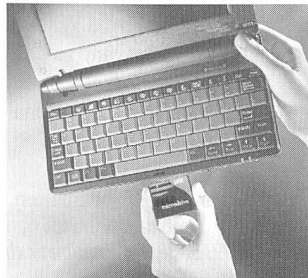
Vor zwanzig Jahren waren 1-Gigabyte-Festplatten so gross wie ein Kühlschrank

Die Speicherkapazität von Festplattenlaufwerken entwickelt sich in den letzten Jahren schneller als von Moores Gesetz vorausgesagt. Das gilt im Besonderen für das Miniatur-