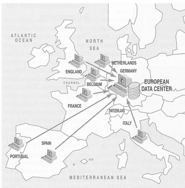
Daten für den Energiemarkt auf Abruf

Die Wissenschaftler verwenden ein Gas aus kalten Cäsium-Atomen, in welchem sich ausbreitende Lichtwellen mit bestimmten Frequenzen durch Wechselwirkungen mit den Atomen verstärkt werden. Nahe der Verstärkungsfrequenz erfährt nun der Brechungsindex des Gases ungewöhnliche Veränderungen. Als eine Konsequenz daraus scheint der Lichtstrahl die Cäsium-gefüllte Kammer 62 Billionstel-Sekunden vor dem Eintritt zu verlassen. Der Effekt beruht auf der Interferenz der verschiedenen in einem Lichtpuls enthaltenen Lichtwellen. Das Kausalitätsprinzip wird nicht verletzt, denn das Experiment kann nicht genutzt werden, um Information mit Überlichtgeschwindigkeit zu übertragen.