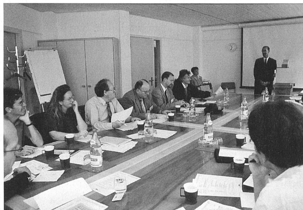
VSE-Medienorientierung am 11. Juli in Zürich.

Bereits heute nimmt die Schweiz international eine führende Position im Bereich der erneuerbaren Energie ein. Praktisch 100% des Schweizer Stroms sind CO 2 -frei und damit ökologisch richtig. Über 60% der Elektrizität wird aus Wasserkraft gewonnen. Nur Österreich und Norwegen erreichen höhere Werte. Im europäischen Durchschnitt kommen 14% des Stroms aus Wasserkraftwerken. Auch bei den neuen erneuerbaren Energien ist die Schweiz top. Unser Land verzeichnet mit 1220 Fotovoltaikanlagen im Netzverbund momentan die grösste Dichte Europas. Allein 1999 wurden 120 neue Anlagen in Betrieb genommen. Aufgrund der kontinuierlichen Anstrengungen der schweizerischen Elektrizitätsunternehmen haben heute rund drei Millionen Haushalte die Möglichkeit, ohne Energiesteuern Solarstrom zu beziehen.