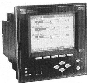
Schalttafeleinbaugerät 7600 ION