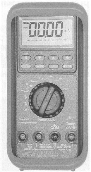
Multimeter und Datenlogger in einem

Das BM 515 von Elbro ist ein Digital-Multimeter mit TRMS-Echt-Effektivmessung und ein mobiler Datenlogger in einem Gerät. Es ist schlaggeschützt und bietet eine beleuchtete, gut ablesbare 3 5/6-Punkte-LCD-Anzeige mit Bargraph sowie einen Datenspeicher für 43 000 Messpunkte. Zur Ausstattung gehören automatische Bereichswahl, Basisgenauigkeit von 0,08%, Data Hold, batterie-schonende Abschaltung, RS 232-Schnittstelle mit Auswertungssoftware sowie abgesicherte Strombereiche. Der Messbereich umfasst Gleich- und TRMS-Wechselstrom bis 10 A (bis 20 A während 30 Sekunden), Gleich- und TRMS-Wechselspannung bis 1000 V, Widerstand bis 50 MOhm, Kapazität bis 1000 µF, Frequenz bis 125 kHz und Temperatur (K-Sonde) von -50 bis