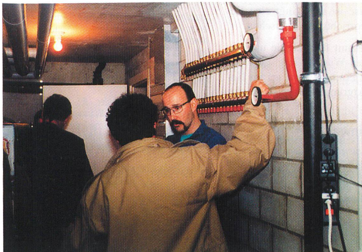
Bild 3 Heizkreisverteiler.

23 °C (ausgelegt wurde die Anlage auf 20 °C). Dennoch funktionierte die Anlage auch bei längeren Kälteperioden einwandfrei.