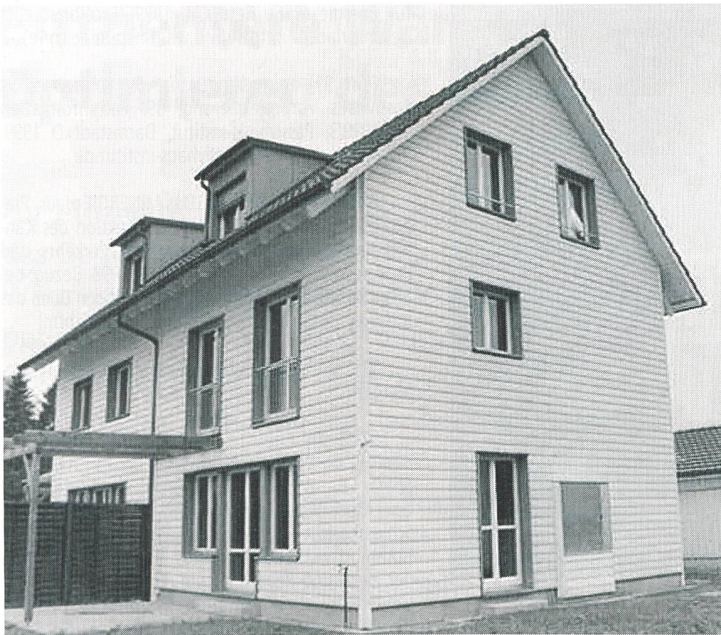
Bild 2 Minergie-Doppeleinfamilienhaus in Grafstal.