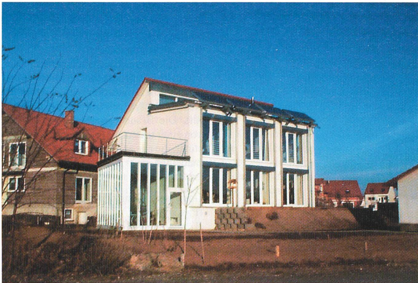
Bild 4 Passivhaus in Büchenau/Bruchsal (Fraunhofer ISE [NTH4 00]).

der Luftqualität. Die Kombination von Einzelraumlüftung und Mauerventilen mit zentraler Absaugung in den Nasszellen ist eine besonders kostengünstige Lösung (1999: rund 3500 Franken). Allerdings ist auf eine ausreichende Schalldämmung zu achten.