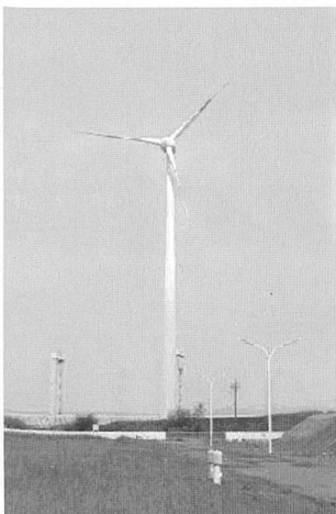
Windkraftanlage in Hamburg-Harburg.

(sm) Shell hat jetzt als erstes Mineralölunternehmen direkt auf ihrem Raffineriegelände in Hamburg-Harburg zwei Windkraftträder mit insgesamt 3,6 MW Leistung in Betrieb genommen. Damit ist das Unternehmen der Betreiber der grössten serienmässigen Windkraftanlagen Norddeutschlands.