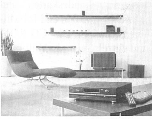
Das neue Gerät unterstützt eine breite Palette von Multimedia-, Online- und Telefonfunktionen.