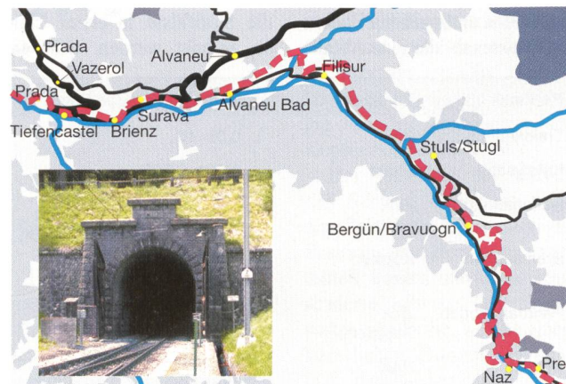
Albulabahn: Fast vollständig erhaltene historische Gebirgsbahnstrecke

Noch hundert Jahre nach ihrem Bau ist die Albulabahn –