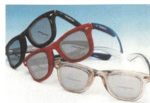
«Swiss Tech Tempest»: Vorspiegelung unverrückbarer Horizonte

Der Seefahrer zog daraus den Schluss, dass dem Auge eine dauerhafte Information zur Position des Horizontes vermittelt werden muss, und konstruierte «Swiss Tech Tempest», eine Brille, welche einen künstlichen Horizont erzeugt und damit den sinnesorganischen Konflikt mit seinen unangenehmen Begleiterschei-