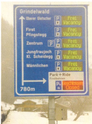
Frühzeitige Information reduziert unnötigen Parkverkehr in Grindelwald.

Grindelwald verfügt über rund 3000 Parkplätze. Für 128 000 Fr. hat sich der Wintersportort als erste Gemeinde im Berner Oberland nun ein Parkleitsystem beschafft, das es den Automobilisten ermöglicht, mit Hilfe von elektronisch gesteuerten Anzeigetafeln freie Parkplätze zu finden. Die Autofahrer werden so rechtzeitig auf Deutsch und Englisch informiert, ob bei der Station Grund, am oberen Gletscher, auf der Station First, bei der Pfingsteggbahn oder im Zentrum noch freie Plätze vorhanden sind. Ansonsten werden sie auf das Park-and-Ride-Angebot hingewiesen. Neben der Gemeinde