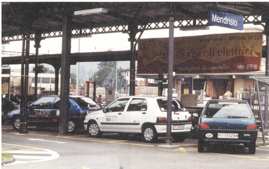
Die Vermietung von Leicht-Elektromobilen ab Bahnhof Mendrisio wurde im Rahmen des Projekts «Easy Move» auf alle fünf grossen Tessiner Bahnhöfe ausgedehnt.

In Mendrisio ist die LEM-Vermietung mit dem Ziel eingeführt worden, ein Kaufinteresse zu wecken. Sie hat jedoch nur vereinzelt Fahrzeugkäufe ausgelöst. Namentlich die LEM-Vermietung am Bahnhof von Mendrisio hat jedoch dazu geführt, dass sich dieses Angebot zunehmend zu einem Element in einer umweltfreundlichen Mobilitätskette entwickelt hat. Das Projekt «Easy Move», das die LEM-Miete abgelöst hat, trägt diesem Aspekt Rechnung. In Zusammenarbeit mit den SBB und dem lokalen Autovermieter bietet dieses Projekt die Miete von LEM direkt ab fünf Tessiner Bahnhöfen an. Damit ergänzen die LEM den öffentlichen Verkehr, bieten Interessierten im ganzen Kanton die Möglichkeit zur persönlichen Erfahrung mit diesen Fahrzeugen und bereichern das Angebot im sanften Tourismus (Informationen unter der Gratis-Telefonnummer 0800 82 22 33).