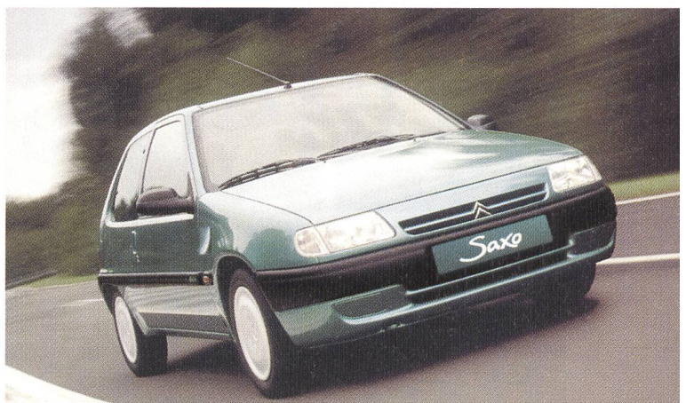
Citroën Saxo électrique im neuen Look.