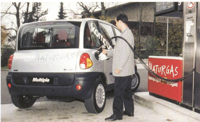
«Bi-Fuel»-Fahrzeug Fiat Multipla.

Betrieb mit Gas oder Benzin bei Fiat der bereits in der Schweiz käufliche Multipla und bei Opel ein Zafira, der nächstes Jahr bei uns auf den Markt kommen soll, zu besichtigen. Ausgestellt waren zudem ein Sportwagen-Prototyp bei Rinspeed sowie ein Fahrzeug mit Wasserstoff-Verbrennungsmotor (und Brennstoffzelle für die Klimaanlage!) bei BMW.