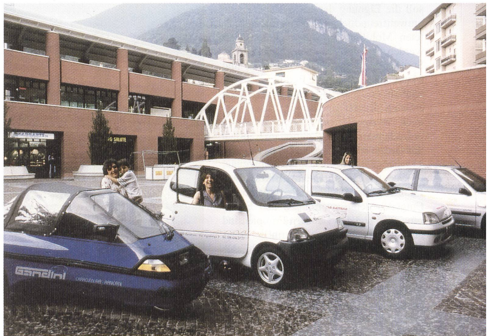
Grossversuch mit Leicht-Elektromobilen in Mendrisio.

Aber auch das Informationsnetz ist äusserst komplex. Es ist keineswegs auf Kundeninformationen beschränkt, sondern umfasst auch Informationen innerhalb der Anbieterkette, beispielsweise Wartungsanleitungen, und – für alternative Treibstoffe von besonderer Bedeutung – zwischen Fahrzeugherstellern und