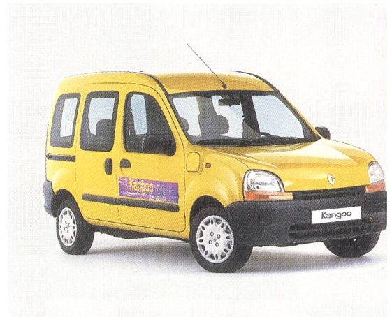
Renault Kangoo électrique: Nutzlasten bis 493 kg.

Unter den weiteren ausgestellten Fahrzeugen mit alternativen Antriebssystemen befanden sich wiederum mehrere Prototypen. Sie waren dieses Jahr jedoch etwas weniger zahlreich als in den Vorjahren und eher bei kleinen