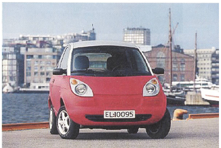
Der Th!nk City von Ford wird dieses Jahr auch in der Schweiz lanciert.

Als weitere alternative Antriebssysteme waren «Bi-Fuel»-Fahrzeuge für den