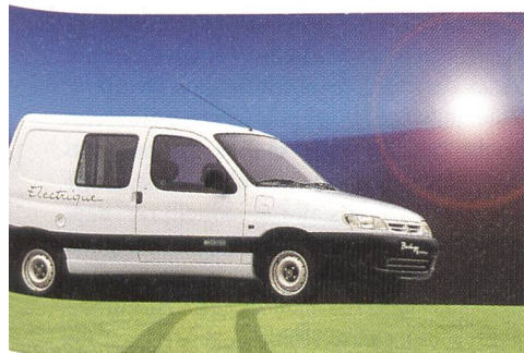
Berlingo électrique: weiterhin im Angebot

Für das Jahr 2001 sind gleich zwei neue Elektrofahrzeuge angekündigt: Der Renault Kangoo und der Th!nk City von Ford. Der rein elektrische Kangoo kommt als Nutzfahrzeug mit einer Zuladung von bis zu 493 kg und als 5-plätziges Familienauto mit einer Nutzlast von 470 kg auf den Markt. Seine Reichweite pro Batterieladung gibt die Direktion für Elektrofahrzeuge von Renault in Paris mit rund 100 km an.