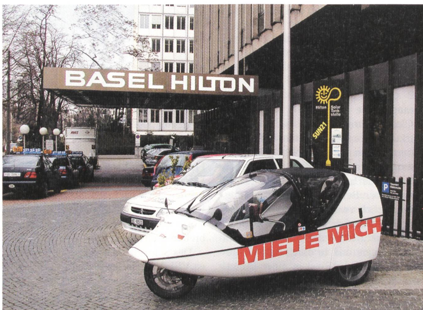
Bereichert das Angebot im sanften Tourismus: Twike.