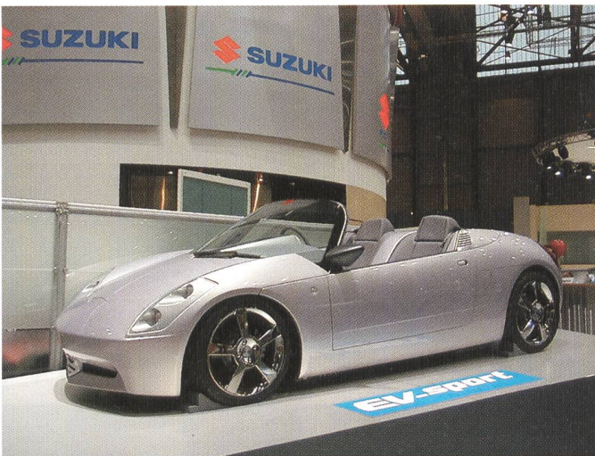
Hybridfahrzeug- Prototyp von Suzuki.