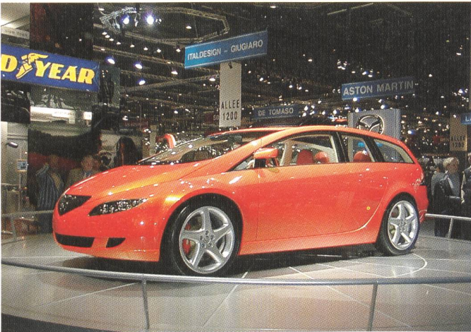
Hybridfahrzeug- Prototyp von Mazda.