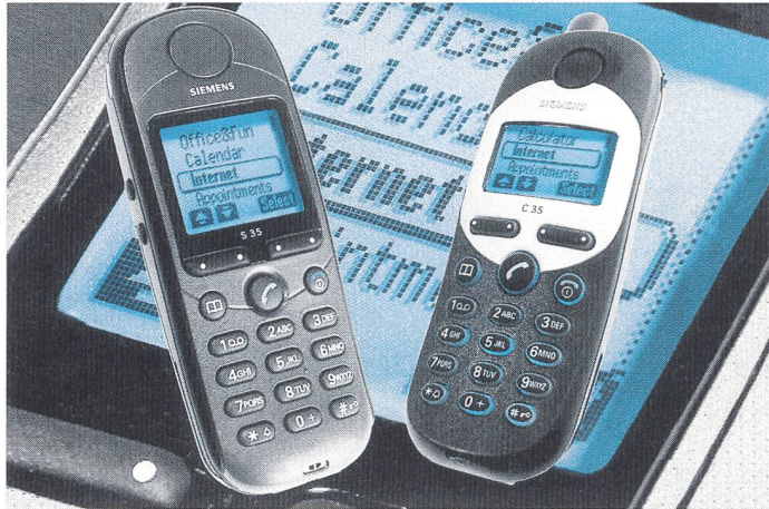
Bild 3 Mobiltelefone im Jahr 2000.

sign immer wichtiger. Das Telefon ist nicht mehr nur Werkzeug, sondern avanciert zum Mode- und Einrichtungsgegenstand.