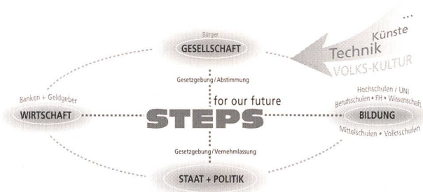
Das Spannungsfeld zwischen Staat, Gesellschaft, Bildung und Wirtschaft unter Einbezug der Volkskultur