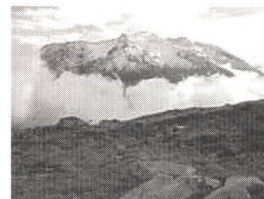
Gelände am Gütsch ob Andermatt.

Kostensenkend wirkt sich aus, dass auf die aufwändigen Windmessungen verzichtet werden kann: 150 Meter neben dem Standort befindet sich eine SMA-Wetterstation. Die Projektplaner müssen die ausführlichen Winddaten nun auf die Nabenhöhe der geplanten Anlage extrapolieren. Eine knifflige Aufgabe stellt sich für den Transport der einteiligen Rotorflügel: Zwar ist der Berg durch eine Militärstrasse erschlossen, doch sind einige Kurvenradien für einen grossen Lastwagen sehr eng. Der Einsatz eines Helikopters wird geprüft.