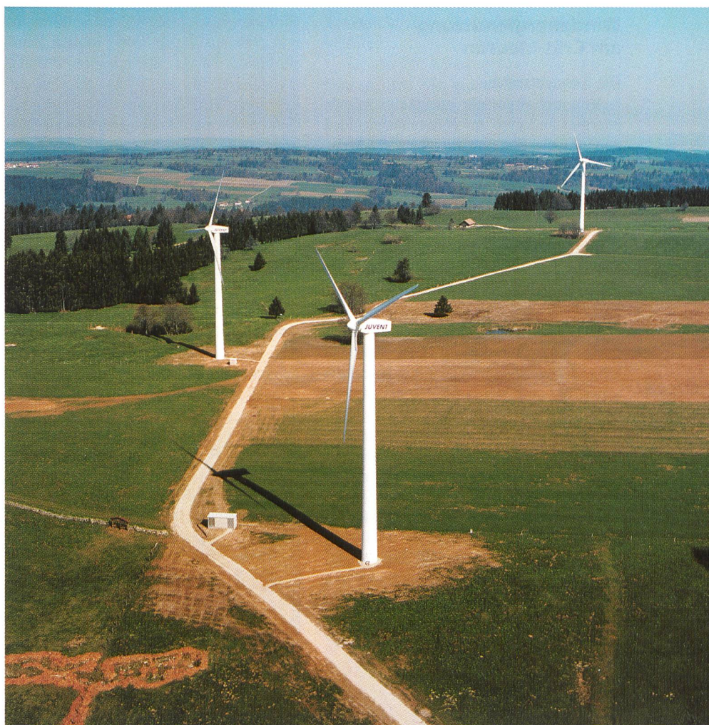
Drei von vier Rotoren des Windkraftwerks auf dem Mont-Crosin.

Mit vier Turbinen und 2,46 Megawatt Leistung ist das Windkraftwerk auf dem Mont-Crosin bisher das mit Abstand grösste der Schweiz. Fünf Kilometer vom alten Standort entfernt, sind nun drei