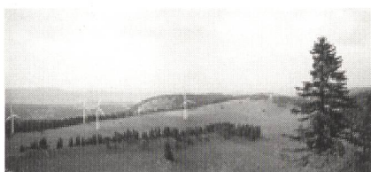
Crêt-Meuron (Fotomontage RES).

Umfassende Abklärungen optimieren die genauen Standorte und die Ausstattung der Anlagen nach (wind-)technischen, ökonomischen, ökologischen, touristischen wie auch sozialen Gesichtspunkten. Dank einer gezielten, stets offenen Kommunikation findet das Projekt Zuspruch bei Schutzorganisationen, betroffenen Gemeinden und einem Grossteil der Bevölkerung. Ziel ist eine Realisierung am Crêt-Meuron bis im Jahre 2002 – die Chancen dafür stehen gut.